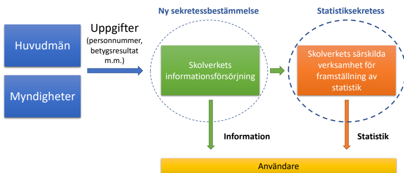
Figur 3.2 Informationsflödet med utredningens förslag

I det följande kommer vi att närmare beskriva informationsflödet. Utredningens uppdrag innebär att lämna förslag som medför att Skolverket tar över insamlingen av uppgifter och hanterar dessa utanför den särskilda statistikverksamheten. Den lösningen kan övergripande beskrivas som i figur 3.2.